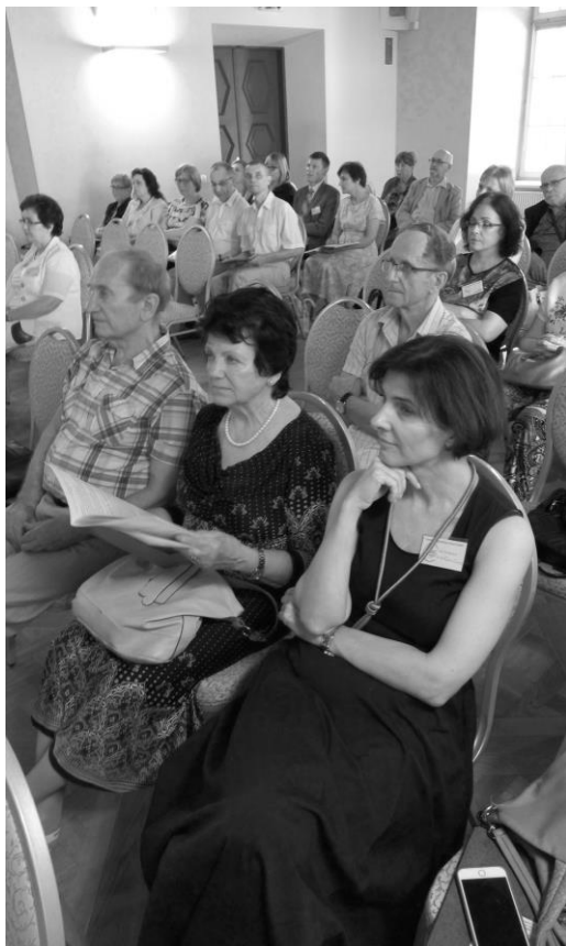
XX MKNJZ, 24–27.06.2016.