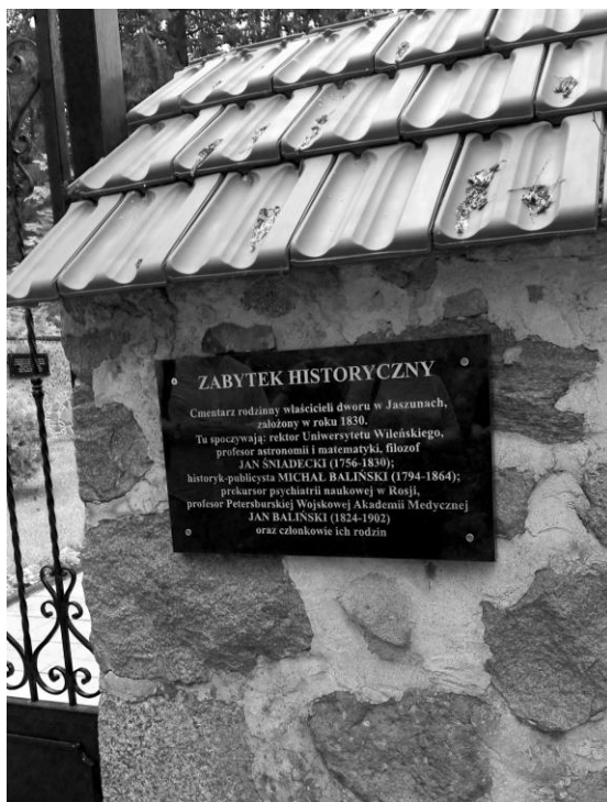
XX MKNJZ, 24–27.06.2016.

Fot. 5. Cmentarzyk rodzinny Balińskich w Jaszunach – tu spoczywa polihistoryk (astronom, matematyk, geograf, etc.), rektor Cesarskiego Uniwersytetu Wileńskiego Jan Śniadecki