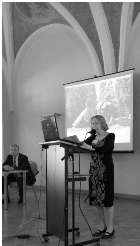
XX MKNJZ, 24–27.06.2016.