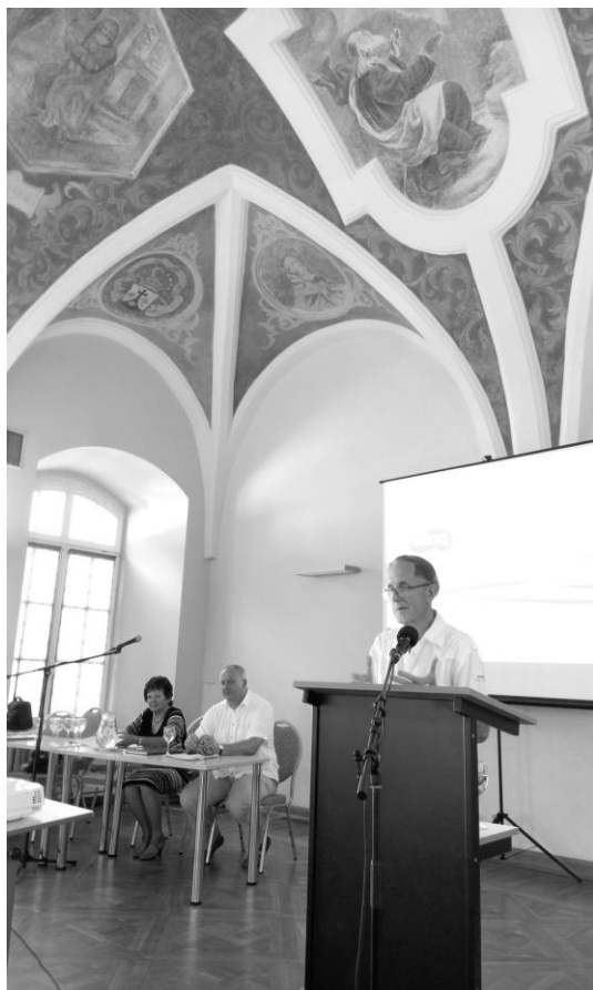
XX MKNJZ, 24–27.06.2016.