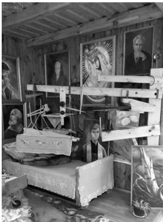
XX MKNJZ, 24–27.06.2016.