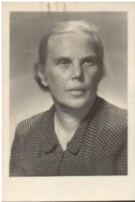
Fot. 1. Zdjęcie prof. Marty Burbianki.